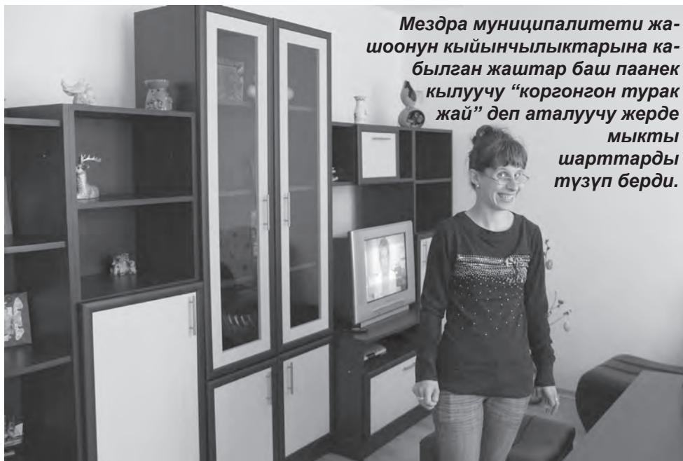
Мездра муниципалитети жашоонун кыйынчылыктарына кабылган жаштар баш паанек кылуучу “коргонгон турак жай” деп аталуучу жерде мыкты шарттарды түзүп берди.