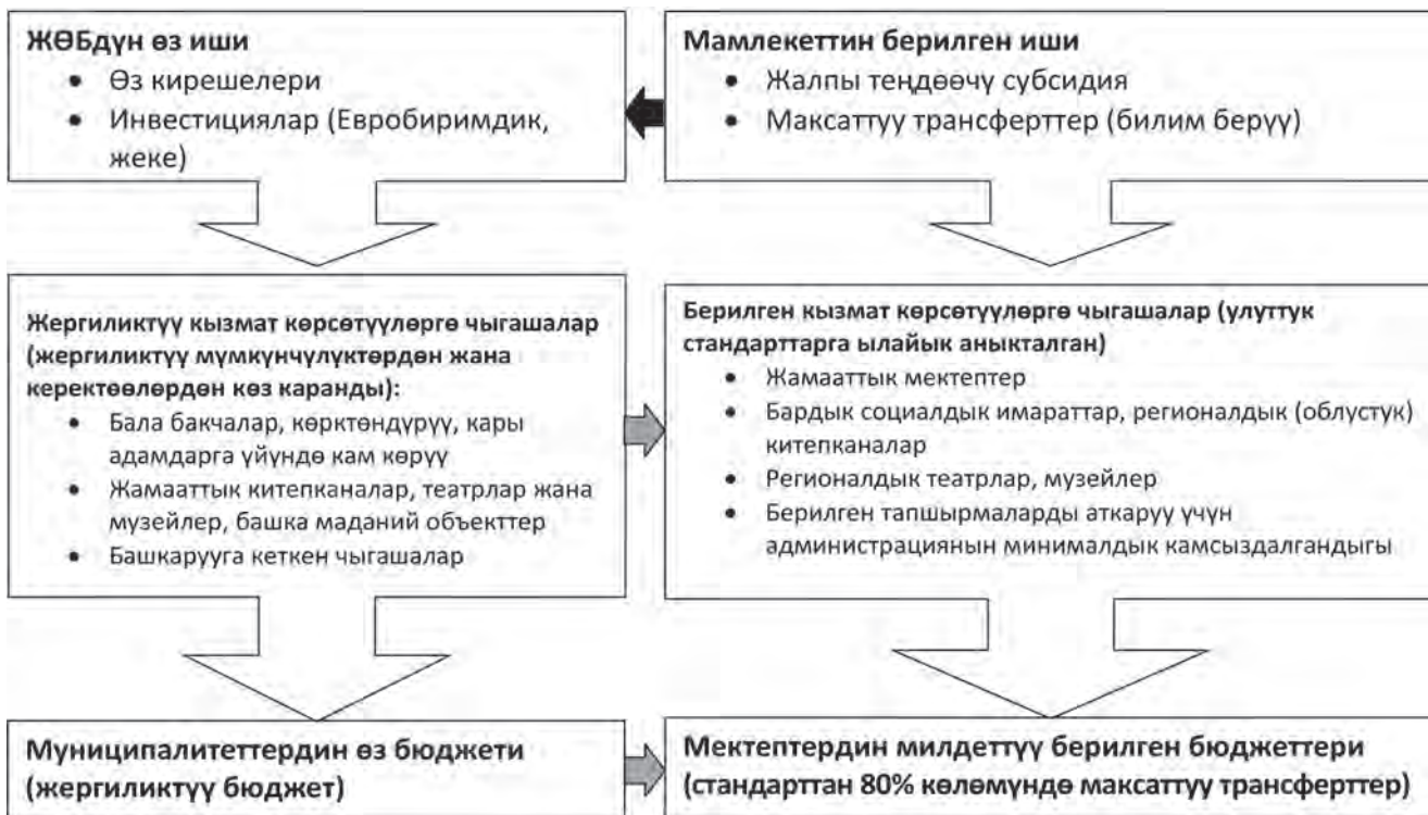
Болгарияда социалдык кызмат көрсөтүүлөрдү каржылоо системасы

Мисалы, “Кооз Болгария” программасынын алкагында социалдык көйгөйлөрдү чечүүгө арналган инфраструктуралардын объекттерин түзүү боюнча муниципалдык долбоорлорду ишке ашырууга сынак өткөрүлгөн. Муниципалитеттер – гранттарды алуучулар курулуш аяктаган соң кызмат көрсөтүү улана берерин, анын туруктуулугун камсыздай турганын далилдеп бериш керек болчу. “Кооз Болгария” программасынын жардамы менен көптөгөн муниципалитеттер социалдык кызмат көрсөтүүнү өнүктүрүү үчүн шарттарды камсыздай алышты. Анткен менен Болгарияга бул маселеде олуттуу жардамды Европа биримдиги көрсөткөнүн жана көрсөтүп келатканын унутпаш керек.